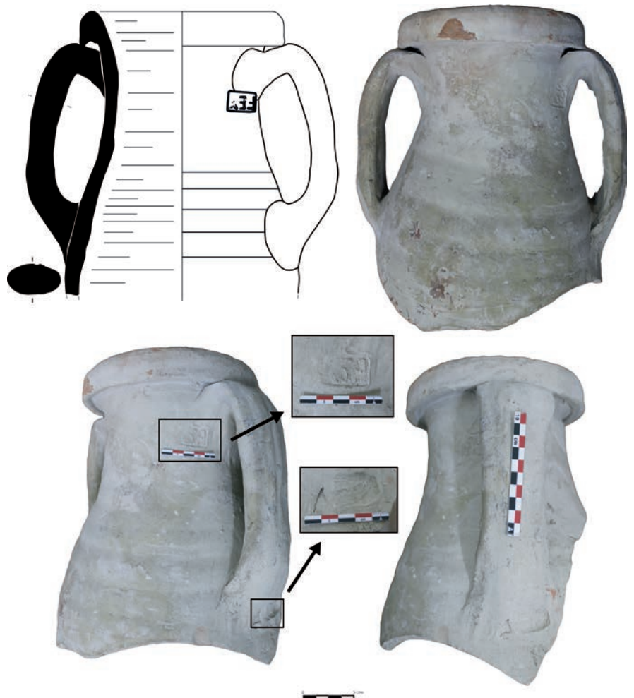
Figura 1. Dibujo arqueológico del individuo de Puerto Real 1 o 2 depositado en el Museo Provincial de Cádiz, donde se observan distintas vistas, con detalle de los sellos.

En este trabajo mostramos un individuo semicompleto de ánfora del tipo Puerto Real 1 o 2, ya que no es posible precisar más debido a la ausencia del pivote (apuntado o umbilicado), que es el que diferencia ambas formas. Esta tipología anfórica es bien conocida en la figlina epónima gaditana de Puente Melchor, que da nombre al tipo (Lavado 2004), y podemos encontrarla con distintos sellos en la zona bajo el borde y/o inicio del asa. Este caso resulta de interés al documentarse dicha forma con doble sello, uno en el inicio del asa en el que podemos leer la marca ante cocturam FEX y otro en el final donde contamos con una marca en cartela elipsoidal, fragmentada (Fig. 1).