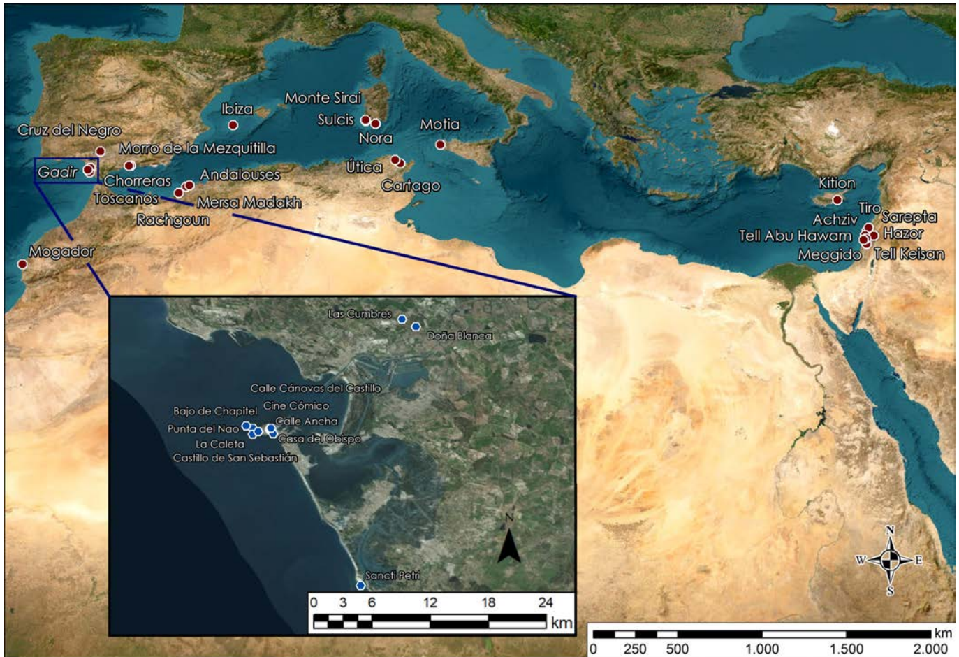
Figura 2. Mapa de dispersión de dipper juglets documentados en el Mediterráneo y la costa atlántica. En detalle, aquellos localizados en Gadir y su hinterland.

ción de recursos marinos. El estudio de estos objetos, y otros similares en curso de análisis también procedentes de La Caleta, pone de manifiesto también la necesidad apremiante de acometer una sistematización y categorización tipológica de los llamados dipper juglets hallados en contextos fenicios occidentales, un conjunto cada vez más numeroso y significativo respecto de la implantación de fórmulas de consumo y ritualidad orientales entre colonos y autóctonos (Fig. 2).