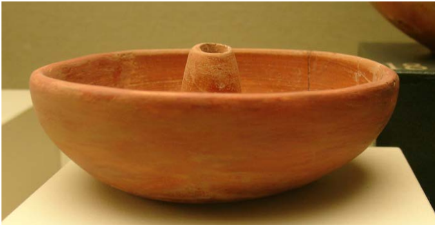
Figura 2. Forma 63 de terra sigillata hispánica tardía de Varea.

Se trata de una pieza restaurada, con el cincuenta por ciento de los fragmentos originales. Tiene unas dimensiones de 0,3 cm de altura, 11 de diámetro en el borde y 8 en la base. En el centro presenta como peculiaridad un compartimento cónico, perforado en el centro, de 2,6 cm de altura y 1,5 de diámetro (Fig. 2 y 3). La pasta es de color rosado, con pigmento exterior de color naranja.