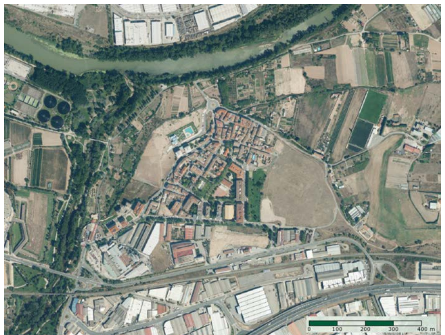
Figura 1. Localización del barrio de Varea (Logroño, La Rioja), según ortofoto de 2020.

Las ruinas del enclave romano de Vareia (Varea), se encuentran bajo el casco urba-