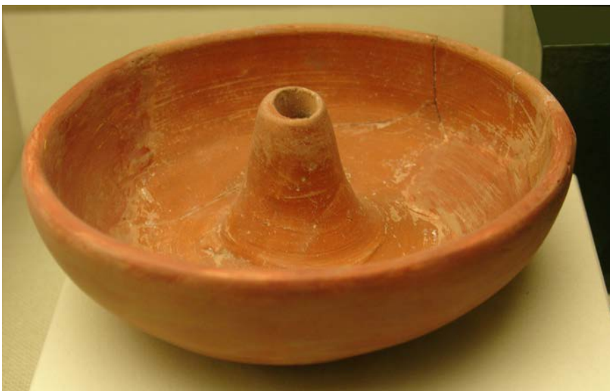
Figura 3.- Vista cenital

Los niveles superiores documentados se dataron entre la segunda mitad del siglo III y el V d.C. (Espinosa y Tudanca 1990: 18-19).