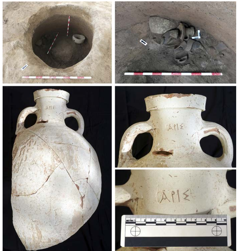
Figura 1. Fotografía del proceso de excavación del silo E3 y detalles del ánfora y el sello.

han aparecido, además, diversos ejemplares de ánfora ibérica (uno de ellos completo); kalathos; cerámica gris ibérica del tipo conocido como cerámica gris de la costa catalana entre los que se encuentran jarritas bicónicas; y cerámica a mano. Por lo que se refiere al material de importación del estrato destacan fragmentos de ánfora grecoitalica (se ha conservado casi la totalidad de un ejemplar del tipo IWe); cerámica de paredes finas (se reconocen diversos individuos de la forma Mayet II, entre los cuales uno está prácticamente entero) y cerámica de barniz negro, entre la que destacan las formas en Campaniense A Lamboglia 8B, Lamboglia 27B y Lamboglia 27ab. La facies de amortización del silo se corresponde, como he-