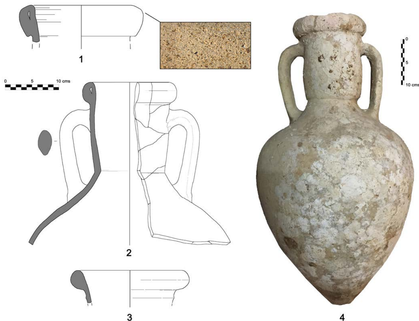
Figura 2. Ánforas MGS II documentadas en distintos puntos del litoral gaditano: 1. Islote de Sancti Petri, 2. Camposoto-Residencial David, 3. Los Chinchorros, 4. Ensenada de Bolonia.

Disponemos igualmente de información contextual para el ejemplar documentado en el saladero de San Bartolomé, en el barrio de Los Chinchorros (Cádiz). Las intervenciones arqueológicas efectuadas entre 2007-2008 bajo la dirección de M. L. Lavado sacaron a la luz una prolongada secuencia ocupacional, distinguiéndose un edificio principal de época tardoarcaica dotado de piletas que, tras varias reformas, termina abandonándose entre finales del siglo II a.C. y principios del siglo I a.C. (Sáez y Lavado 2019). En los niveles I y II de la Fosa 5 (cuadrante