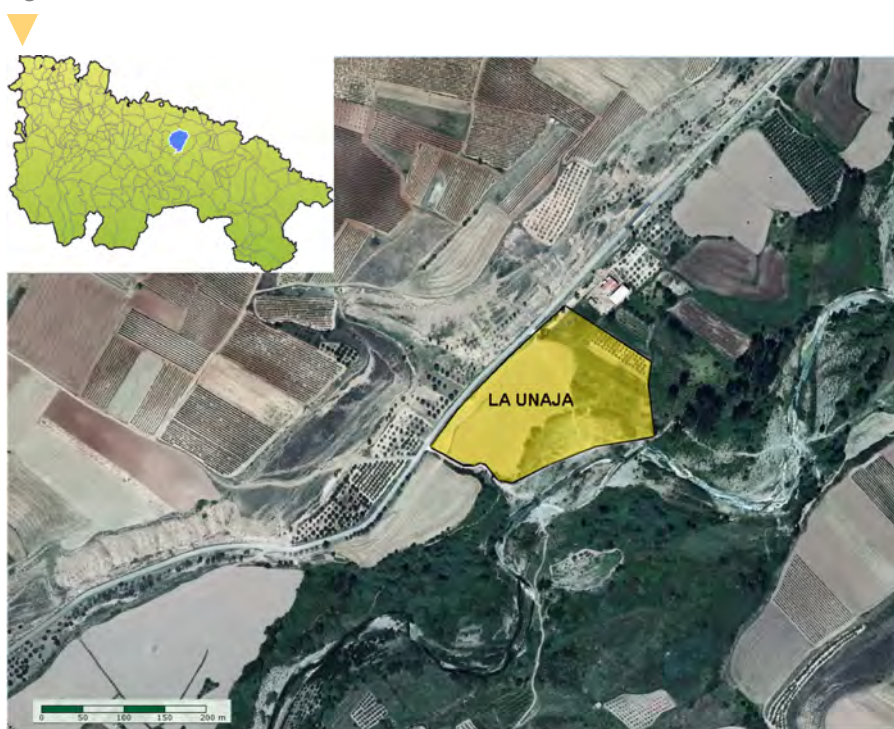
Figura 1. Localización de la Unaja o Tejera (Ribafrecha, La Rioja).

Los restos cerámicos de terra sigillata hispánica son abundantes, tanto lisa como decorada (Fig. 2 A y B). Entre las formas lisas destacan la Hisp. 7, 8, 15/17, 35, 44, 94 y entre las decoradas la Hisp. 29, 37 y Hermet 13. Entre la cerámica