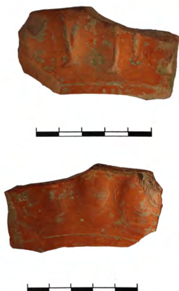
Figura 3. Plato forma Paz 82c procedente de La Unaja o Tejera (Ribafrecha), con detalle de la decoración interior

común están presentes las grandes vasijas para almacenamiento de áridos y líquidos, dolia del tipo Vegas 49 y sus correspondientes tapaderas ( opercula ). En cuanto a la cerámica engobada pintada se registra únicamente la forma Uunzu 3/ Aguarod I.