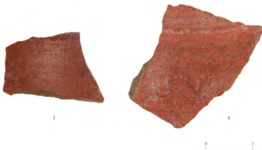
Figura 3. Otras formas cerradas engobadas de la Cibdá de Armea.

San Cibrán de Las y TSH en Castromao (Rodríguez Nóvoa 2020: 589-592).