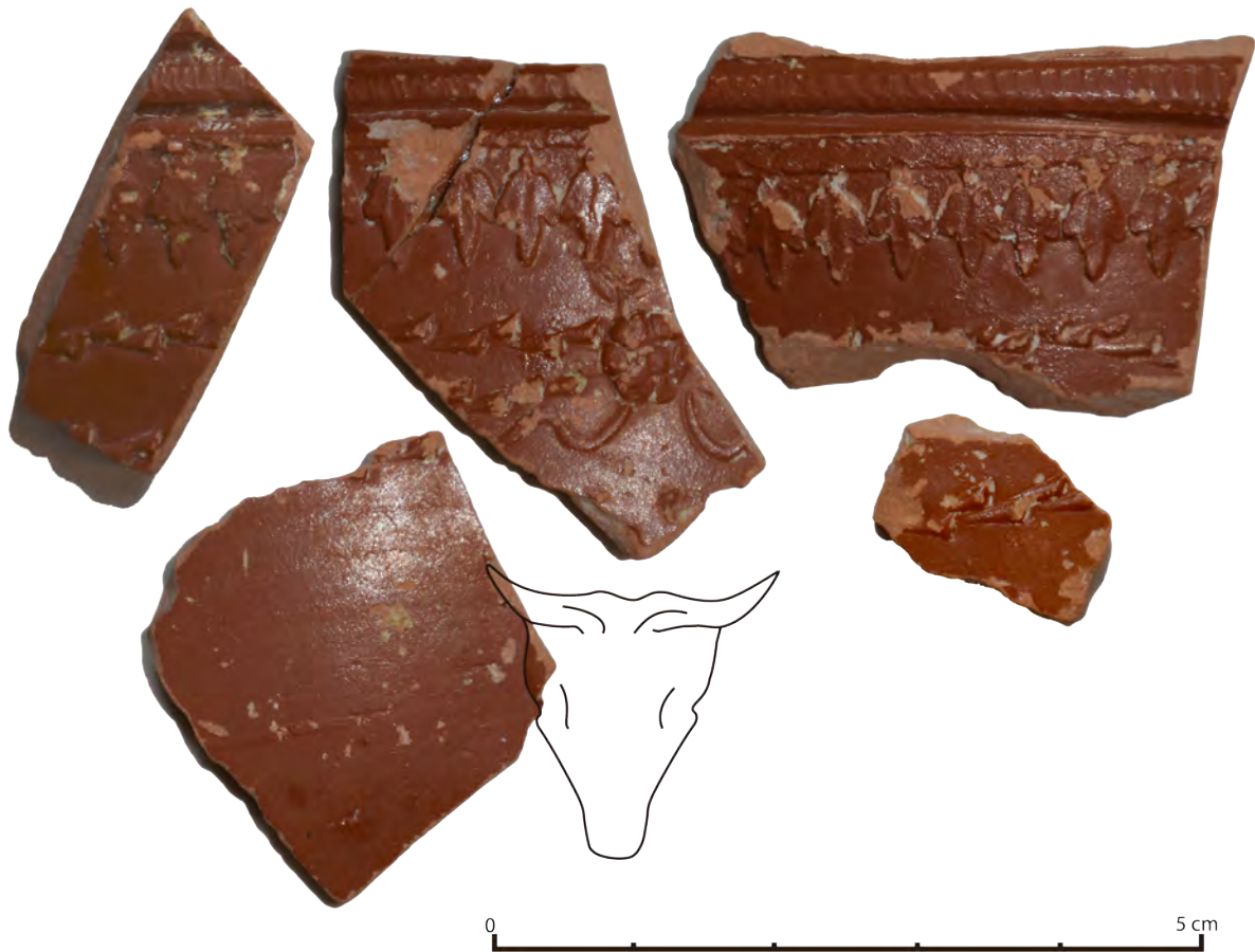
Figura 1. Fragmentos del vaso de P. Cornelius

(P. CORNE). En la actualidad, esta firma abreviada se asocia a su primera fase de producción, localizada muy excepcionalmente porque corresponde una producción de la que tenemos escasa documentación (Troso 1991).