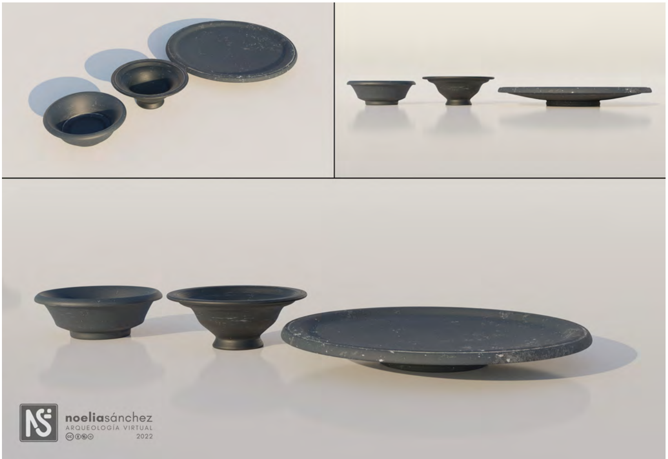
Figura 3 Reconstrucción hipotética en 3D de la vajilla de GBR hallada en Elo. Noelia Sánchez Fernández/OPPIDA 2022.

tono más oscuro en el color (10YR3/2) fruto de incremento de la temperatura en atmósfera plenamente reductora que confieren a la misma el tono oscuro deseado. El tratamiento de la superficie es bruñido y pulido, de tacto suave que se asemeja en la distancia con los barnices negros menos cuidados (Fig. 1.3).