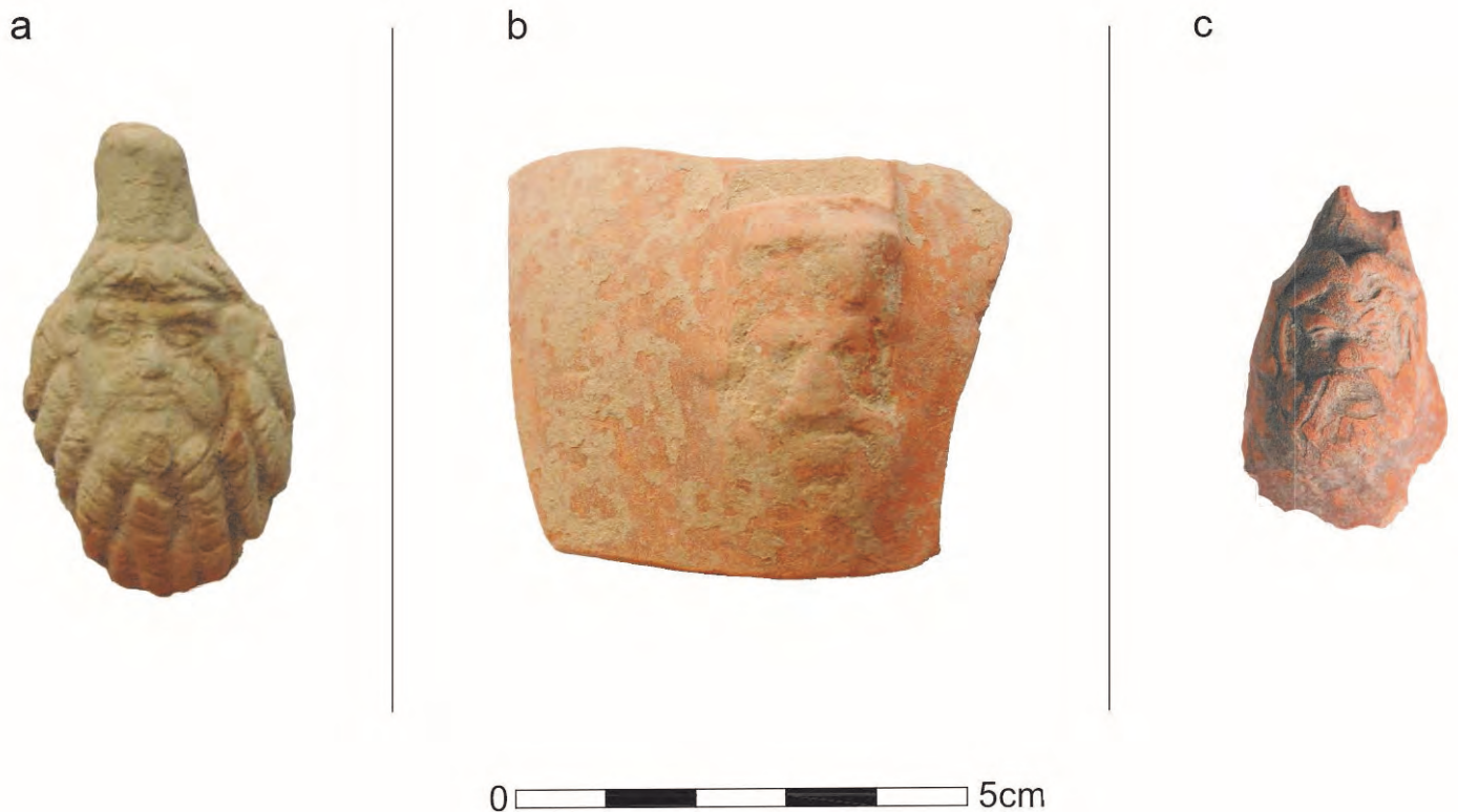
Figura 2. Imagen y dibujo del positivo del molde antropomorfo barbado procedente del Cerro de los Mártires (San Fernando, Cádiz) (a); y paralelos de apliques de tamaño e iconografía similares, relacionados con las producciones de vajilla de engobe rojo de “tipo Kuass” de Centro Atlántida (b) y Torre Alta (c).

locales a través de análisis arqueométricos (Bernal et alii 2019). Estos últimos hallazgos, mejor conservados que los documentados en el propio Cerro de los Mártires, se han vinculado a partir del análisis iconográfico con representaciones dionisiacas. Todo ello sugiere que, si realmente proceden del mismo taller, en él debieron utilizarse diversas variantes de moldes e iconografías para la producción de las conocidas carátulas barbadas.