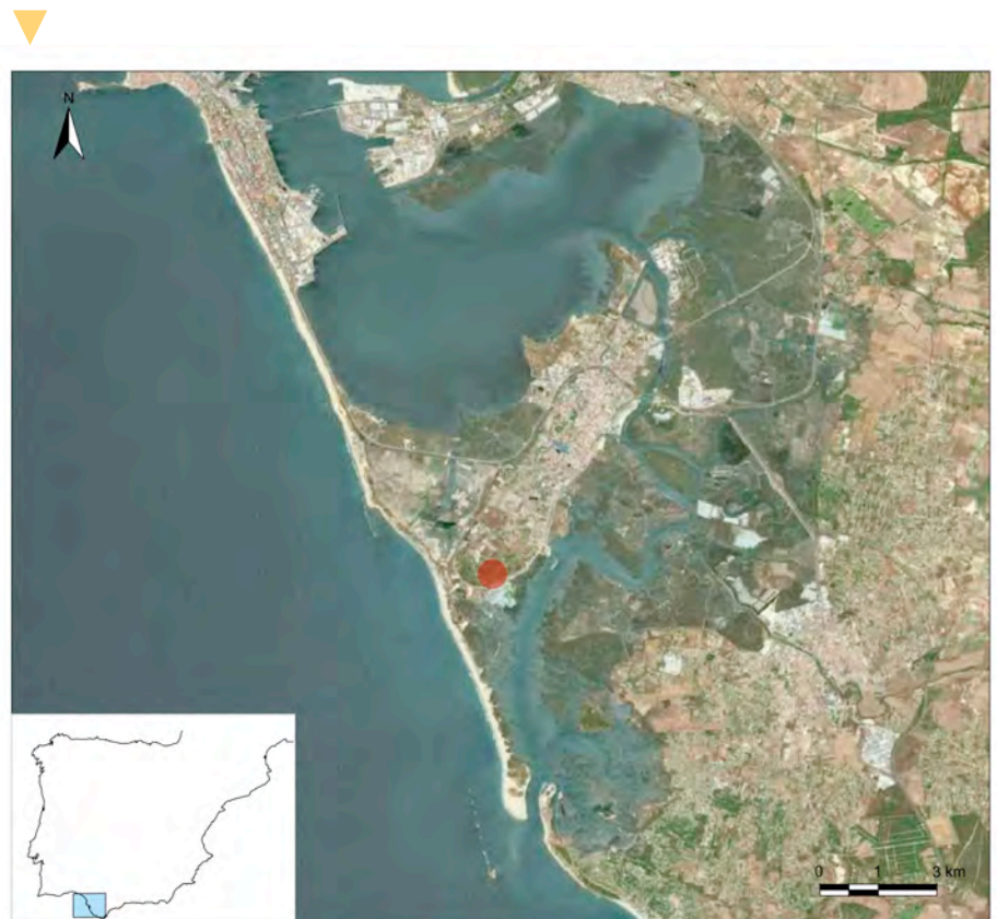
Figura 1. Plano con la ubicación del yacimiento Gallineras-Cerro de los Mártires (San Fernando, Cádiz).

Se cree que la zona alta habría contado, al menos, con dos estructuras fornáceas dedicadas a la fabricación de ánforas principalmente, y, de manera secundaria, a la elaboración de cerámicas comunes de mesa y cocina, terracotas, lucernas, e imitaciones locales de formas de cocina africanas. Las intervenciones han permitido comprobar que se trata de hornos de grandes dimensiones, con un diámetro de aproximadamente 4 m. Asimismo, en las proximidades, se hallaron evidencias de testares (Sáez et alii 2011; Díaz y Arévalo 2021). En la zona baja del cerro, se han identificado siete posibles piroestructuras de menor entidad, aunque solo una se ha podido examinar con cierto detalle. Estas parecen haber estado dedicadas fundamentalmente a la producción de ánforas salazoneras, cerámicas comunes y ma-