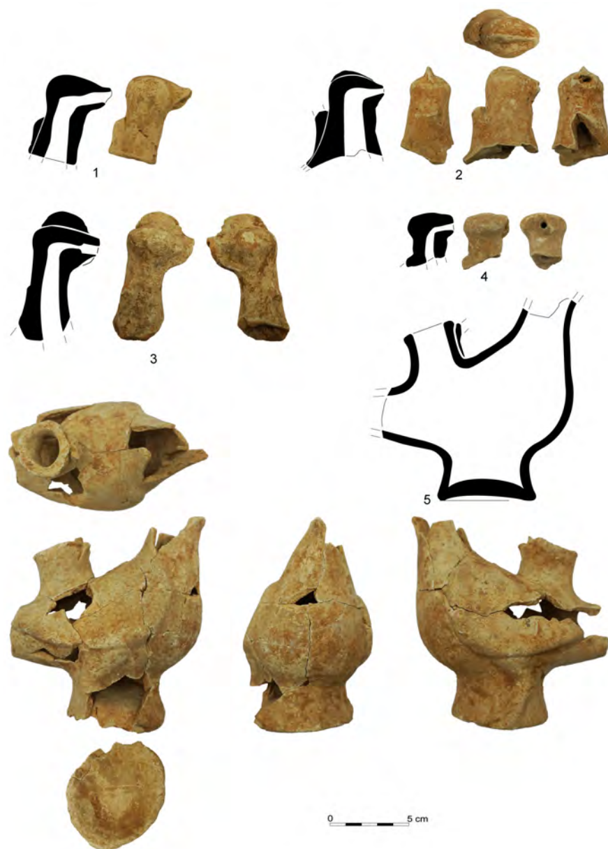
▲ Figura 1. Conjunto de askoi zoomorfos hallados en los vertidos que amortizan la cantera de Santa Bárbara en Cádiz. Cabezas del Tipo A (1 y 4, UUEE 87 y 93 respectivamente); cabezas del Tipo B (2 y 3, UUEE 87 y 88 respectivamente); perfil casi completo del tipo realista (5, U.M. II).

En cuanto a su funcionalidad han sido vinculados con ambientes cultuales y de necrópolis, tanto asociados a enterramientos como a las prácticas rituales pro-