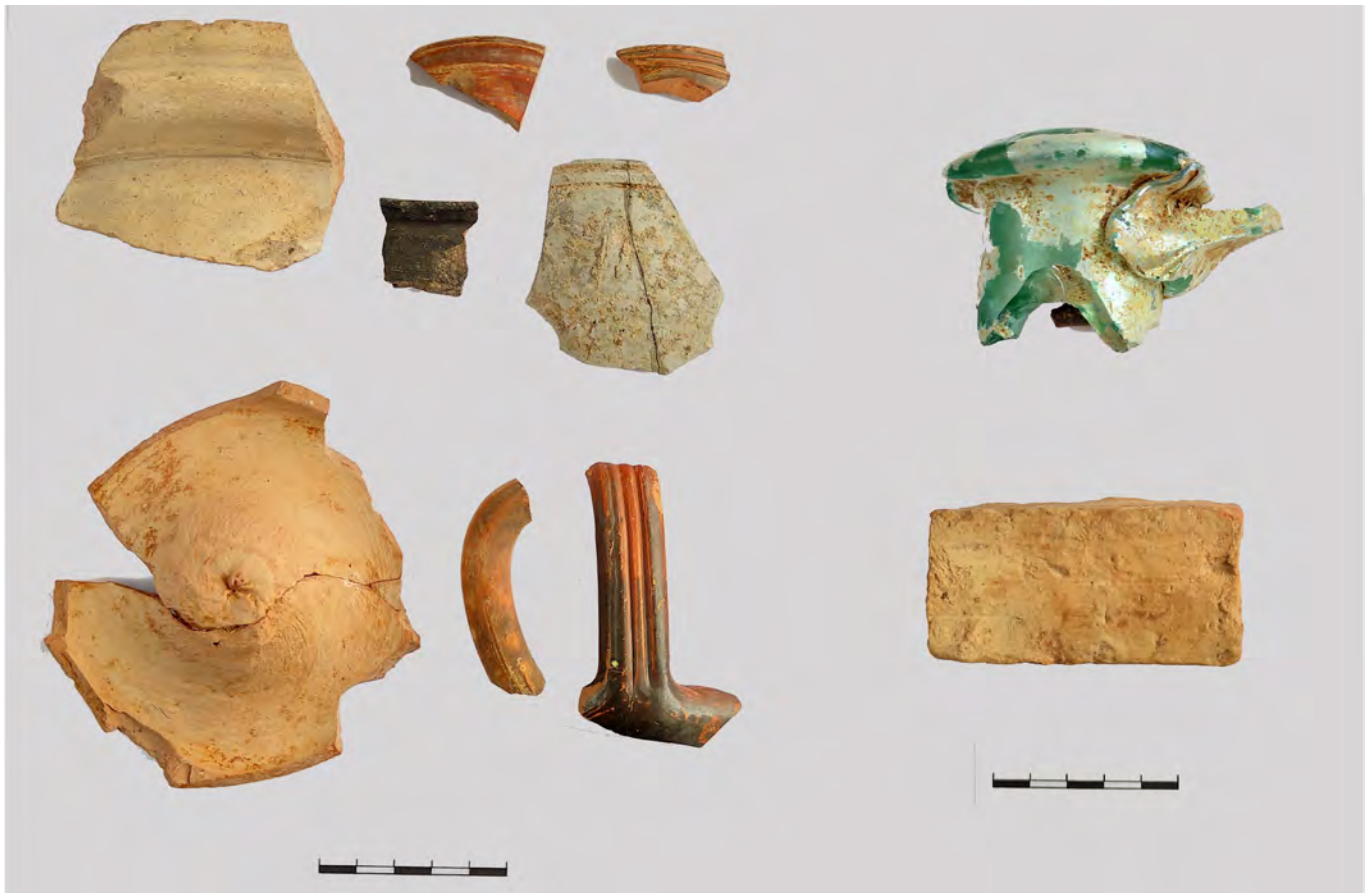
Figura 2. Contexto arqueológico del fragmento de vaso de paredes finas decorado a molde-

vaso son característicos de la producción del ceramista calagurritano Verdullus .