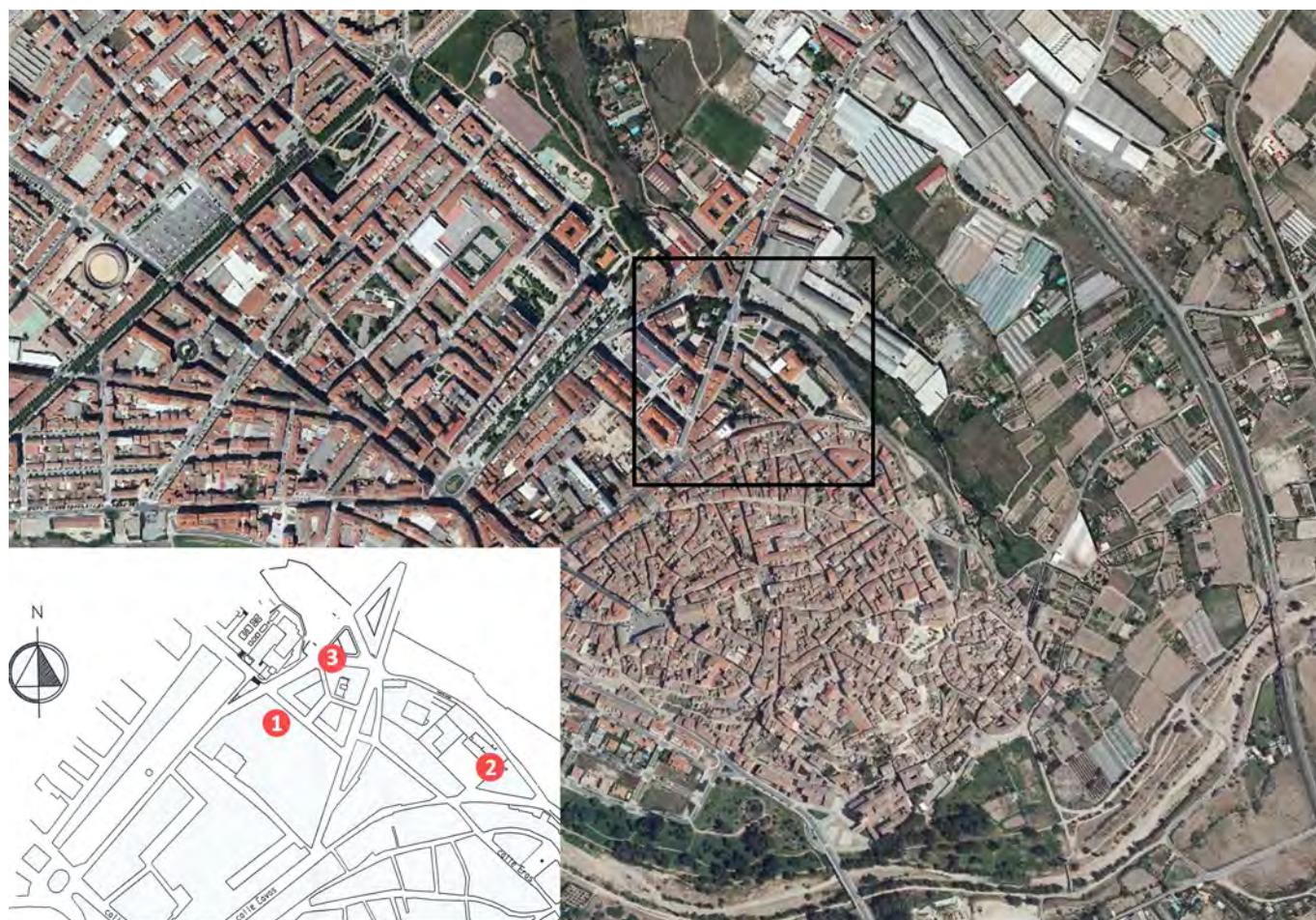
Figura 1. Plano del casco antiguo de Calahorra con la localización de los hallazgos: 1. Centro comercial ARCCA. 2.- La Clínica 3. Doctor Chavarría.

cronología coetánea (Gil y Luezas, 2012: 355-406).