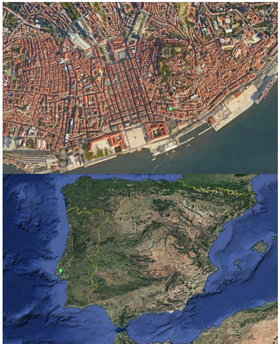
Figura 1. Localização do sítio em Lisboa e na Península Ibérica.

surge implantada sobre um terreno previamente contido em período romano. A escavação permitiu perceber que, nessa época, o topo deste desnível se encontrava alguns metros mais a Norte, criando provavelmente um barranco que se precipitava sobre a margem do rio, permeável à erosão. A intervenção incidiu então sobre uma série de depósitos de aterro retidos por, pelo menos, duas estruturas de contenção dos terrenos e de travamento das rochas em desagregação da colina sobranceira à Catedral, que encontramos arrasadas pela escadaria e rampa de acesso à Sé. Nestes depósitos,