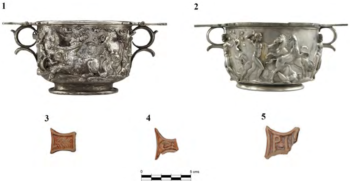
Figura 1. Paralelos de la forma Mayet XXXVIII A en metal: 1. Copa del tesoro de Berthouville (Villa Getty) y 2. Copa de la Casa de Menandro, Pompeya (Museo Arqueológico de Nápoles), prototipos de la forma de paredes finas analizadas en este trabajo. Así como ejemplos de los apliques de la forma Mayet XXXVIII A procedentes de Mesas de la Frontera (4. Decoración con una palma enmarcada, 5. Decoración con una lira enmarcada y 6. Decoración con dos letras "P" e "I" enmarcadas) (Mayet 1971, Reinoso 2019).

bebida (Mínguez Morales 2005). Mayet (1975) señala que este tipo de cuencos fueron reconocidos por primera vez en la Península Ibérica, pero se extienden a lo largo de toda la cuenca occidental del mar Mediterráneo. En cuanto a la cronología, podemos adscribir esta producción a la segunda mitad del siglo I d.C., entre el reinado de Claudio hasta la dinastía de los Flavios.