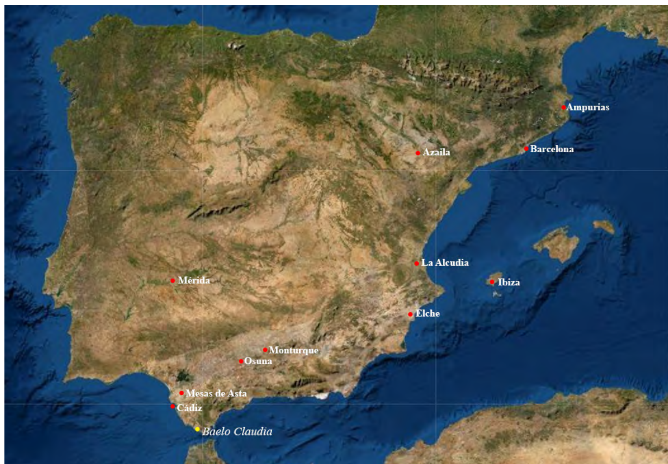
Figura 3. Mapa de la dispersión de la forma Mayet XXXVIII A.

des finas béticas podrían situarse entre la costa gaditana y el valle del Guadalquivir. Las dos piezas baelonenses que aquí presentamos, atendiendo al análisis macroscópico de su pasta, son de producción bética, de un taller indeterminado.