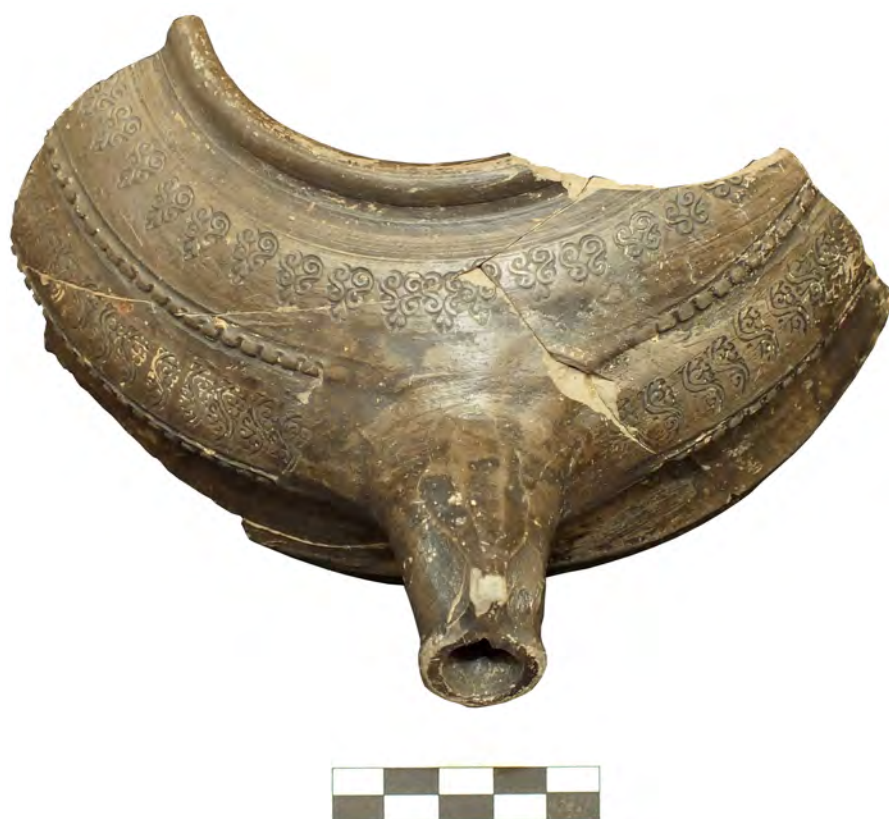
Figura 3. Visión frontal del vertedor o pitorro del vaso Rigoir 23.

res que han estudiado esta forma (p.e. Boixadera et alii 1987: 99; Bacaria et alii 1993: 348). Se observa el arranque de una asa, que no se ha conservado, y en el extremo opuesto un vertedor tubular o pitorro que a simple vista se ve que ha sido añadido una vez modelada la pieza al torno y estampillada, ya que se han alisado todos los elementos decorativos que tiene estampados alrededor (fig. 3). Presenta una pasta fina, bien depurada, vacuolada, con escaso desengrasante de mica plateada -es el que abunda más-, algún punto de cal y también algún punto agrisado. Color en general gris, más claro o más oscuro según los fragmentos (figs. 2, 3 y 4).