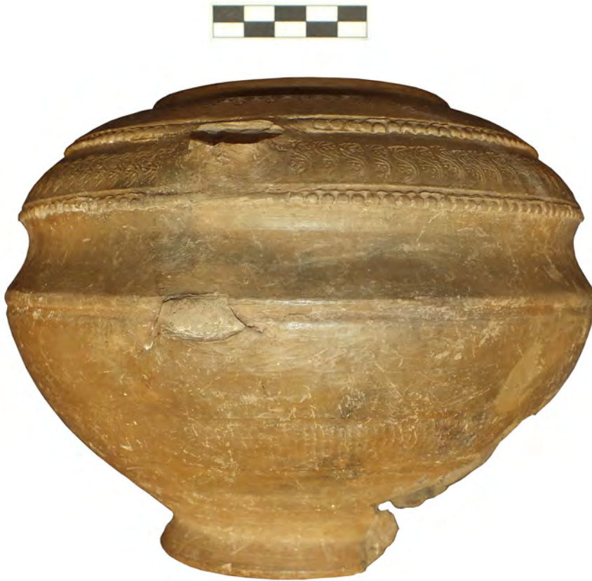
Figura 4. Parte posterior del vaso con el arranque de asa.

no solo existe semejanza formal, también los motivos decorativos situados en frisos enmarcados por líneas de perlas contribuyen a hermanar ambos vasos. El ejemplar hallado en Can Ferrerons, no tan usado como el de Sainte-Propice, permite también conocer como era el fondo, ya que ofrece el perfil prácticamente completo, salvo el asa. Creemos que todo ello nos autoriza a proponer un origen provenzal, probablemente marsellés, para nuestro ejemplar, igual que se admite en el caso del de Sainte-Propice (Boixadera et alii 1987: 101), y también para una parte del material D.S.P. de la zona catalana según los análisis arqueométricos, especialmente de Barcino . Dicha producción se engloba en el grupo G6, elaborado entre la segunda mitad del siglo V d.C. e inicios de la centuria siguiente (Bacaria et alii 1993: 351-352; Bacaria y Buxeda 1999: 354-355). La datación de los vasos D.S.P. en general resulta difícil de determinar con precisión