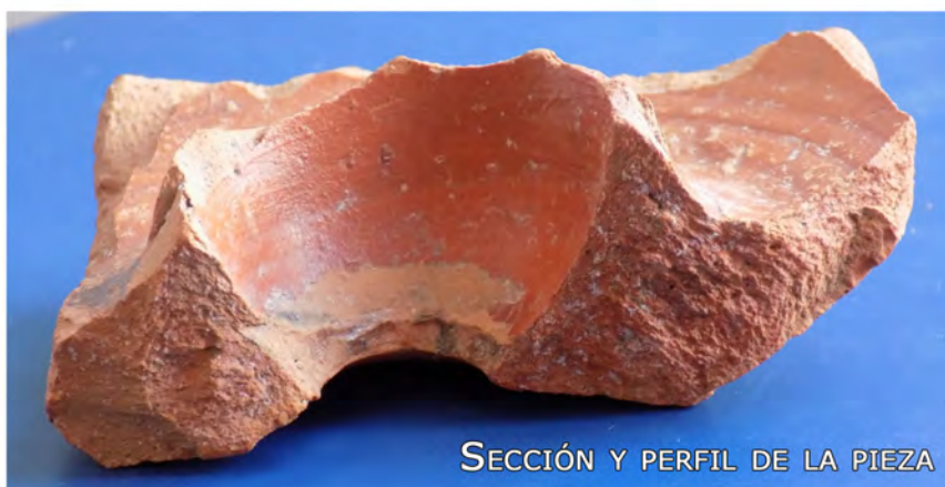
Figura 1. Imágenes de la pieza toledana.

interior de la pieza bastante rebajado. Posteriormente, parece ser que, se procede al añadido de la masa que se utiliza para elaborar el resalte o la pequeña cazoleta, dándole una inclinación bastante pronunciada y que, prácticamente, nace desde el centro de la base. Al interior, se aprecia de igual forma, la unión y el acabado de ambas labores.