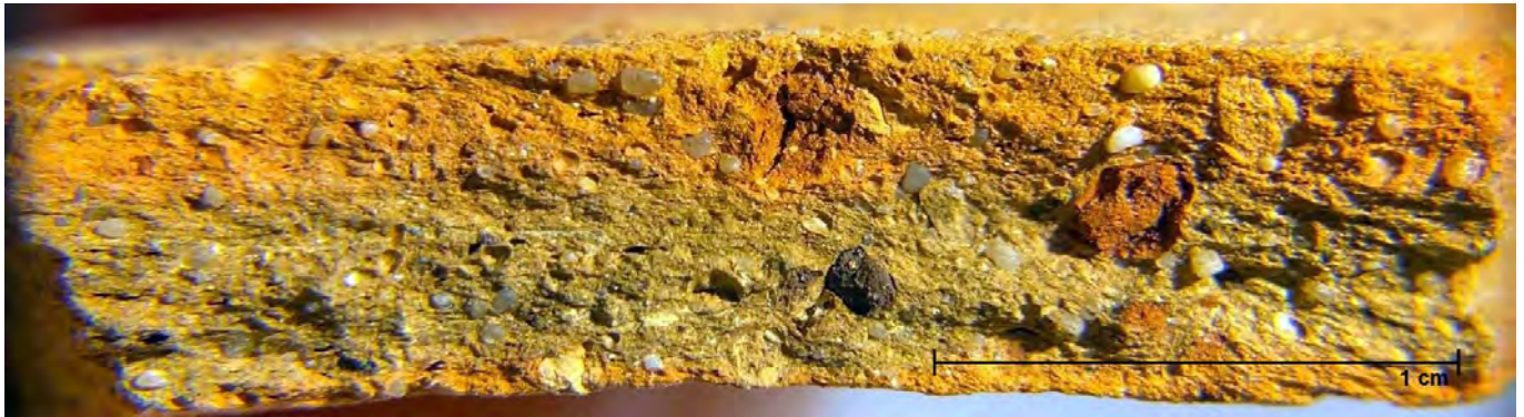
Figura 2. Pormenor da pasta cerâmica da Dressel 14 parva de Sines.

vio-trajana (Mayet e Silva, 2002, 103-105; Mayet e Silva, 2009, 59).