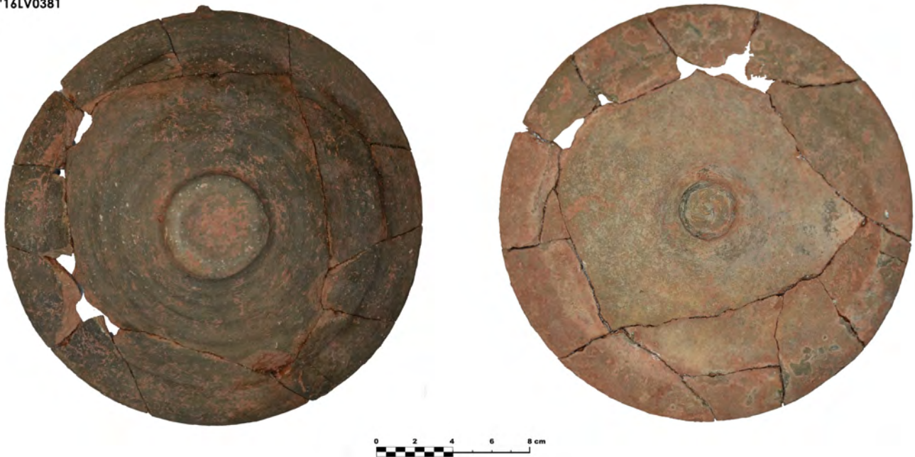
Figura 3. Parte externa e interna de la tapadera de borde en ala.

tamiento debido al impacto de algún elemento de peso, tal y como podría ser la techumbre del ambiente, por lo que entendemos que la misma se encontraría vacía o en cualquier caso con elementos orgánicos que no se han conservado.