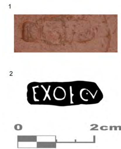
Figura 2. 1. Sigillum en el fondo de interno de la Hisp.27. 2. Ilustración de EXOF C.A (José Luis Fuentes Sánchez/OPPIDA)

La formula utilizada es la típicamente abreviada para las officinae isturgitanas EXOF-EXOFFICINA- mediante el cual se ha expresado el nombre del offinator bajo la disposición de los dua nomina C.V, con interpunción media y una umbilicación en la zona superior de las grafías de C y A. Es común y habitual hallar en las