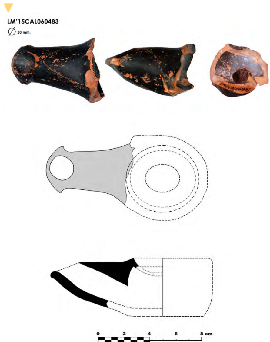
Figura 2. Fragmento LM15CAL060483 en planta y sección con representación de la forma (José Luis Fuentes Sánchez/OPPIDA 2016).

más concretamente en el tipo D de la clasificación de Ricci (1973: 215). También puede situarse en el tipo “cilíndrico del esquilino” (Granchelli et alli 1997: 30; Beltrán 1990: 264 fig.125, n°1115) siendo lucernas semiabiertas de cuerpo cilíndrico medio o alto, con disco cóncavo circular y opérculos grandes, paredes estilizadas que están realizadas a torno y suelen llevar aleta lateral, incluso perforada. La forma de ancla de la piquera es un rasgo que alude a sus precedentes helenísticos y determinante para nuestra clasificación aunque no el único como observaremos,