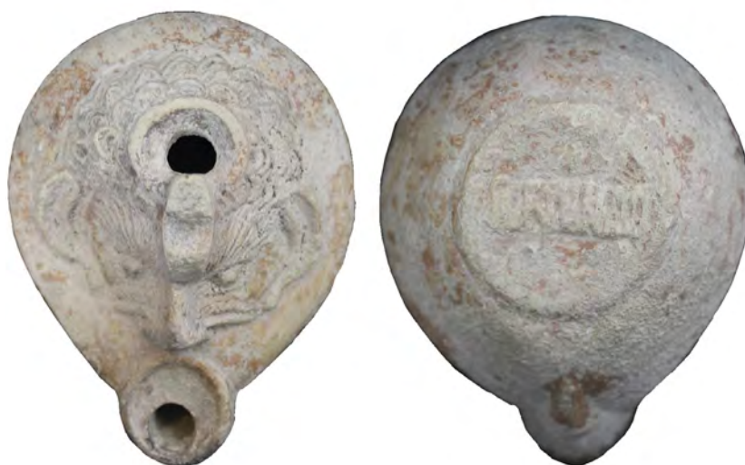
Figura 1. Imagen delantera y trasera de la lucerna localizada.

Esta circunstancia excepcional hace que la pieza apareciera totalmente lavada y descontextualizada por los procesos postdeposicionales en los que se ha visto envuelta. Hipotetizar sobre su posible procedencia sería algo que no tendría cabida en una publicación de estas características. Sin embargo, su estado de conservación apunta a un contexto cerrado, posiblemente, formando parte del depósito funerario de una tumba asociada a las múltiples villae que aparecen en el entorno.