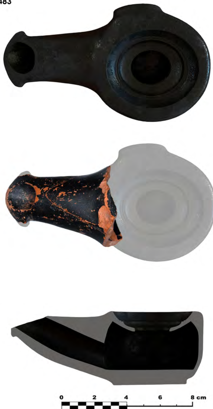
Figura 3. Modelado 3D de la forma Ricci D en base a las evidencias morfológicas de la parte conservada de la lucerna (José Luis Fuentes Sánchez/OPPIDA 2017).

zona central inferior del rostrum , común en este tipo, nos posibilita proyectar concordancias de simetría próximas con los prototipos de la Ricci D (Figura 3).