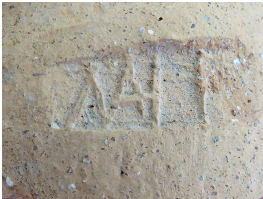
Figura 2. Detalle marca

El cognomen Mabes está bastante extendido en sigilla sobre opus figlinae , especialmente sobre Terra Sigillata