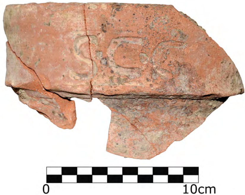
Figura 1. Fotografía del ánfora Dressel 1 con marca de La Bienvenida-Sisapo.

El rasgo más sobresaliente de la pieza es, sin embargo, el sello que lleva impreso en el labio, dentro de una cartela rectangular de 3,2 cm de alto y aproximadamente 7,5 cm de ancho, constituido por tres letras incisas ( litteris cavis ) de lectura directa S.C.G., se-