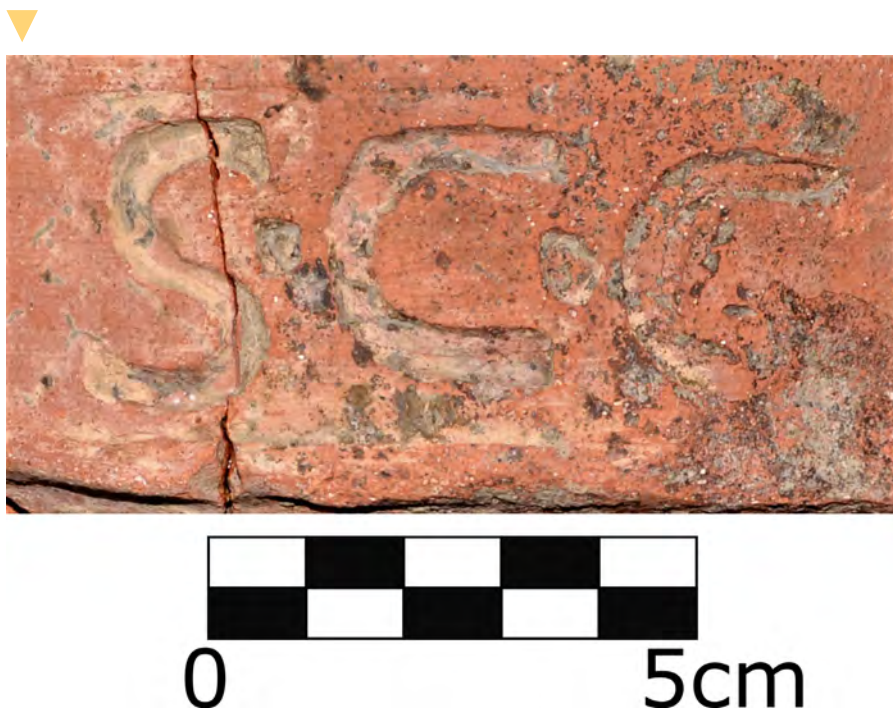
Figura 3. Detalle del sello con lectura S. C. G.

La importación de contenedores salsarios del Círculo del Estrecho está constatada en otros puntos del yacimiento desde fechas tempranas, concretamente en el contexto sellado del lienzo sur de la muralla, donde fue hallado un borde de ánfora Mañá