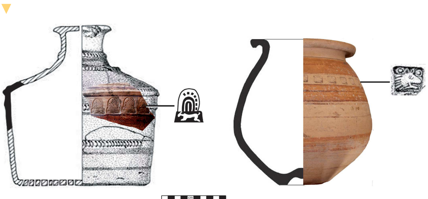
Fig. 2.- Izq.: Reconstrucción del posible tipo cerámico tarro-colador, a partir de Fernández et alii 2007: 226. Dcha.: Urna o tinajilla de la necrópolis de Las Esperillas (Camuñas, Toledo)

Se han hallado ejemplares bícromos del “Área de Valdepeñas” en la necrópolis de Palomar de Pintado (Villafranca de los Caballeros). Y cerámicas estampilladas muy similares en los yacimientos del Cerro Calderico (Consuegra), el Cerro