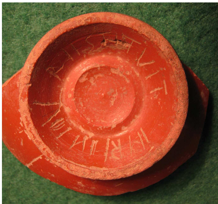
Figura 2. Foto de la pieza (Clariana).

ejemplares con marcas incompletas, que presentan la particularidad de omitir la letra "H" y, según el dibujo publicado por Ribas, en una de ellas, la letra "L" estaría a medio camino de una "G" (Ribas 1972 172, i g 47, 3).