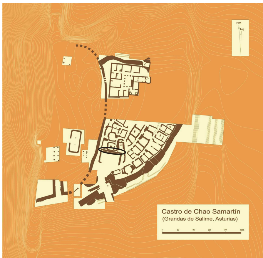
Figura 1. Planimetría general del yacimiento con indicación de la zona de aparición de la pieza.

Para una aproximación cronológica más precisa, debemos recurrir a los datos que nos puedan proporcionar los pocos materiales recuperados con cierto potencial datante. Es el caso, entre las importaciones, de unos fragmentos de cerámica vidriada (Hevia y Montes 2009b: 645-646; Fig. 2.5) verosíblemente relacionados con una morfología tipo skyphos de la forma II de López