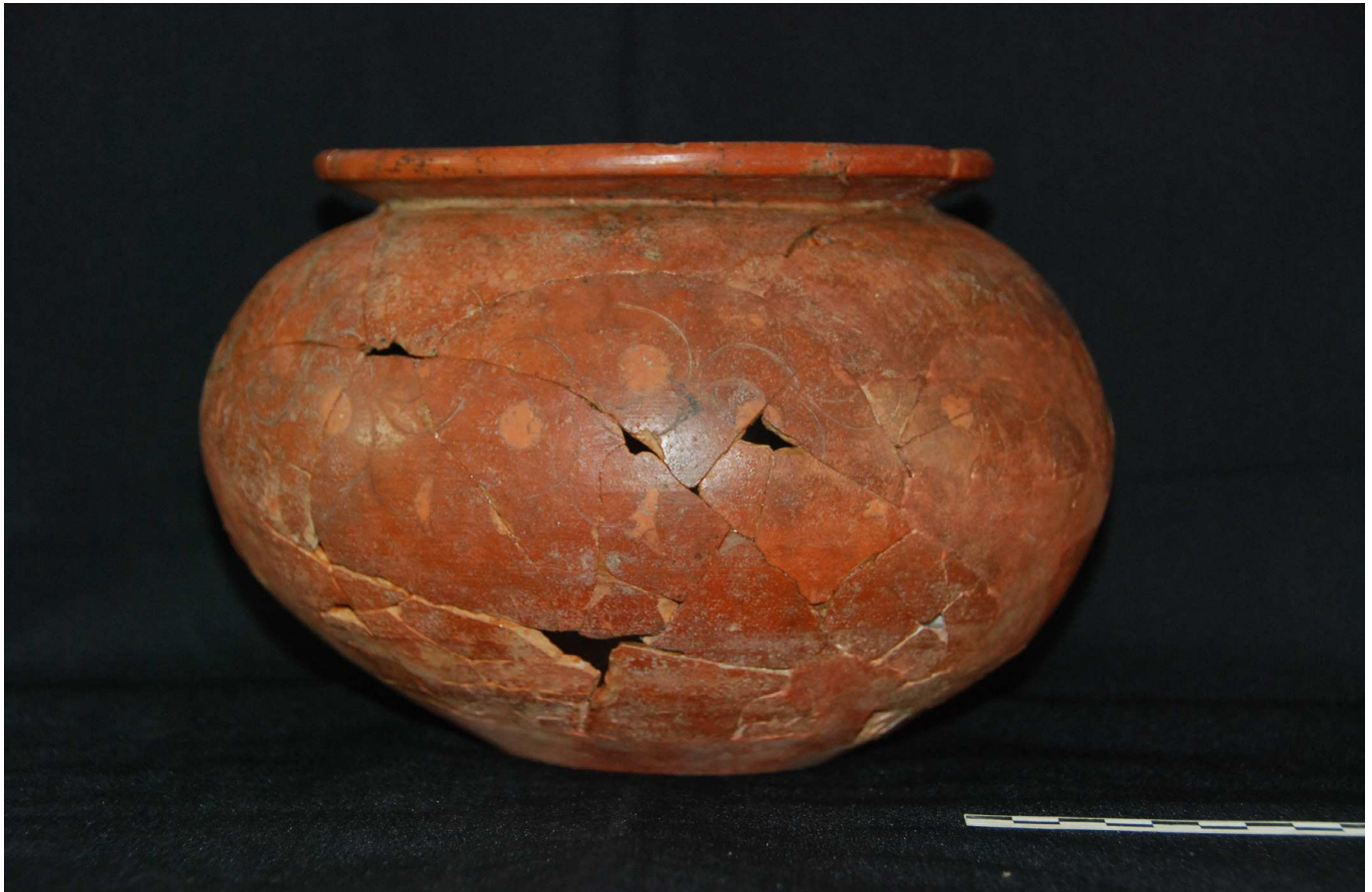
Figura 2. Fotografía de la pieza.

En lo que respecta a los tratamientos superficiales, tanto en la cara externa como en el borde se puede apreciar un acabado bruñido sobre el cual se aplicó un engobe de una tonalidad ocre anaranjada.