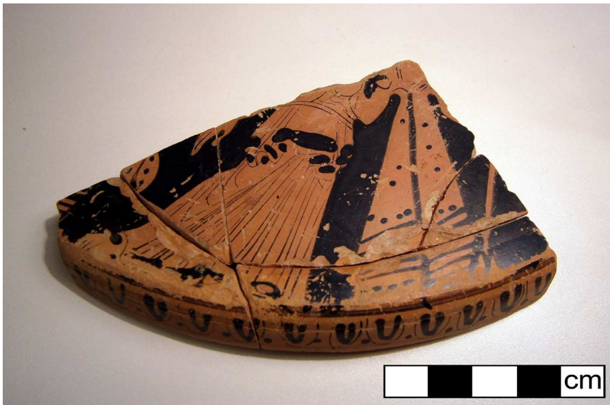
Figura 2. Dibujo del mismo fragmento, con el perfil del borde de la tapadera (Pons, 2002: 228).

pieza estudiada aparece solamente una pequeña parte de la escena original.