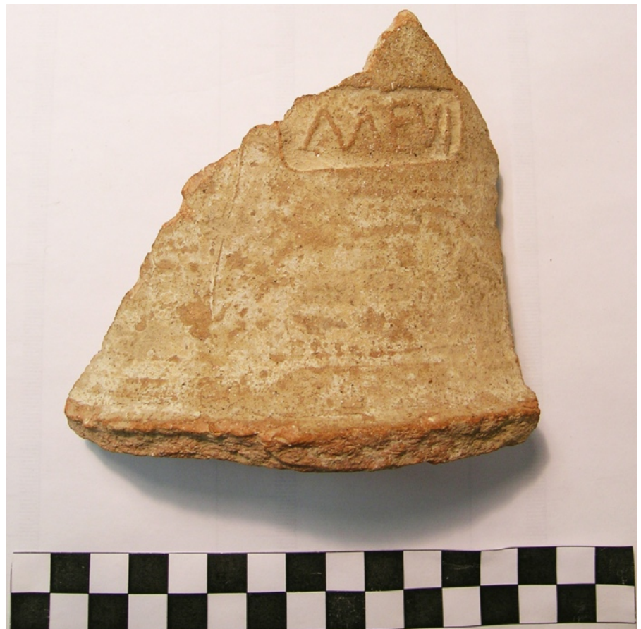
Figura 1. Fotografía del fragmento de ánfora con el sello MEVI.

Dentro de estas muestras epigráficas, una de ellas nos llamó especialmente la atención, pues si bien se trata de un sello conocido desde hace bastantes años dentro de la epigrafía anfórica tarraconense, nunca se había documentado en la tipología que exponemos en esta noticia. Estamos refiriéndonos al largamente conocido sello MEVI, del que hasta la fecha se habían identificado dos variantes, la que mostramos en este trabajo y otra que parece más antigua y que se desarrolla como Q. MEVI, correspondiendo la primera letra a un praenomen , concretamente Quintus , junto con el nomen Mevius en genitivo. Se trata de un gentilicio bastante extendido en la zona de Campania, Lacio y la ciudad de Roma, así como en las provincias de Numidia y Africa Proconsularis . En cambio, en Hispania , únicamente se ha documentado en inscripciones lapidarias un Titus Me-