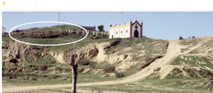
Figura 1. Emplazamiento de los hornos altos del Cerro de los Mártires, junto a la ermita homónima, desde la hondonada dejada por las canteras en los años sesenta-setenta.

Una de las principales actividades desarrolladas en el fundus de Gallineras-Cerro de los Mártires fue la alfarera, ubicándose una importante agrupación de hornos (en torno a seis) en la zona baja del yacimiento, mientras que probablemente otros dos como mínimo habrían estado ubicado en las cotas más altas del cerro. Estos últimos, apenas limpiados superficialmente en los años setenta, parece que alcanzaban grandes dimensiones (unos 4 mts de diámetro) y se encontraban en un óp-