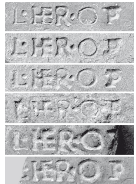
▲ Figura 2. Marcas de L. HER. OPT. sobre tegulae de la uilla de El Moralet, Benidorm (Abascal, 2009: 186. fig. 1).

En cuanto a su cronología, las piezas de Portmán aparecieron de forma aislada, sin estar vinculadas a una estructura o estratigrafía concretas. Sin embargo el